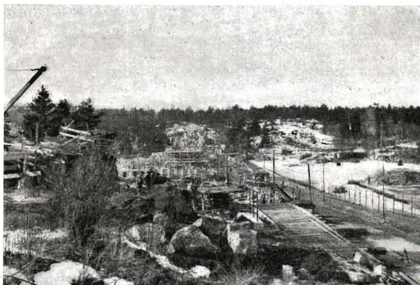
Här skall förlängningen gå fram utmed Telefonvägen.

eller omedelbart väster därom, visade det sig önskvärt att få en mera rationell sträckning till stånd. På begäran av SS igångsattes därför nya undersökningar, varvid framkom ett förslag att föra banan i tunnel genom Hägerstensåsen. Härvid skulle visserligen något större engångskostnader uppkomma som en följd av tunnelbygget men i gengäld för all framtid stora driftbesparingar ernås och en trafiktekniskt bättre lösning åstadkommas. Efter ingående prövning inom stadens myndigheter fastställde stadsfullmäktige i oktober 1944 den av SS föreslagna sträckningen. Sedan beslutet härom fattats begärde gaturkontoret byggnadstillstånd och igångsatte därefter terrasseringsarbetena.