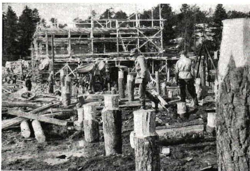
Även träpålar måste användas för att förbättra stabiliteten hos den särskilt dåliga grunden.