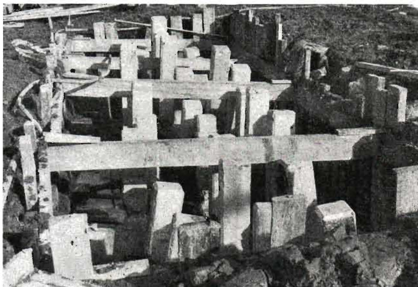
Dessa betongpelare i täta rader skall bära upp en del av viadukten över Korpmissövägen.

Redan till hösten detta år (1945) väntas flera tusen personer inflytta i nya bostadshus på Hägerstensåsen. Till denna tidpunkt torde icke hela banför-